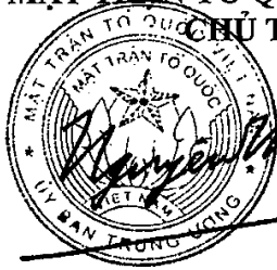
Nguyễn Thiện Nhân

TM. ĐOÀN CHỦ TỊCH ỦY BAN TRUNG ƯƠNG MẶT TRẬN TỔ QUỐC VIỆT NAM CHỦ TỊCH